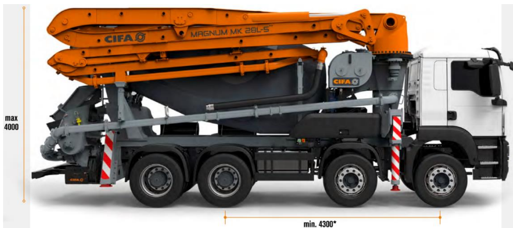
Abbildung 1: Fahrzeugabmessungen Fahrzustand